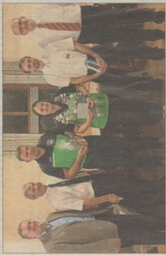
Gratulationen für die Gewinner der Schießwettbewerbe.