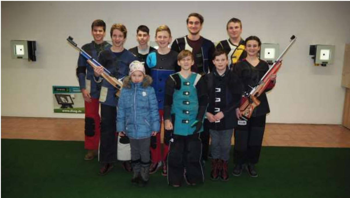
Jugend Stand 1.2019