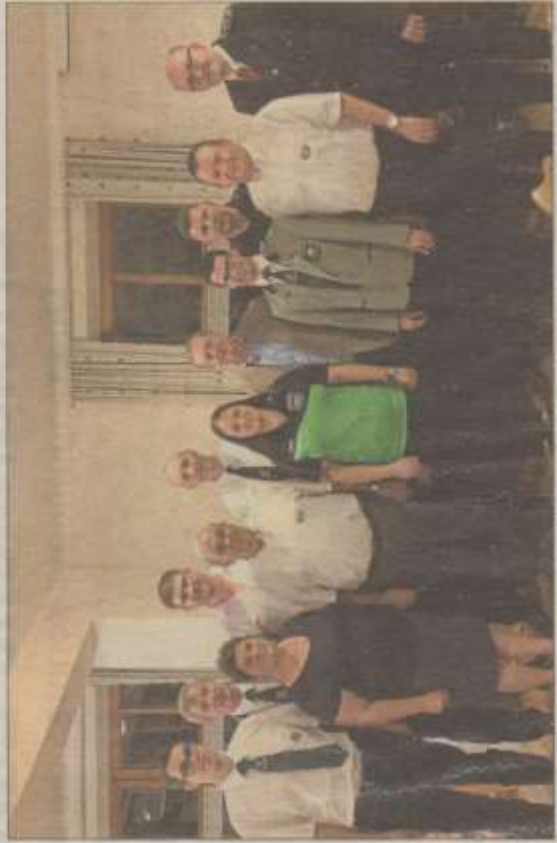
Die neu gewählte Vorstandschaft der Eichenlaub-Schützen Bachhausen.