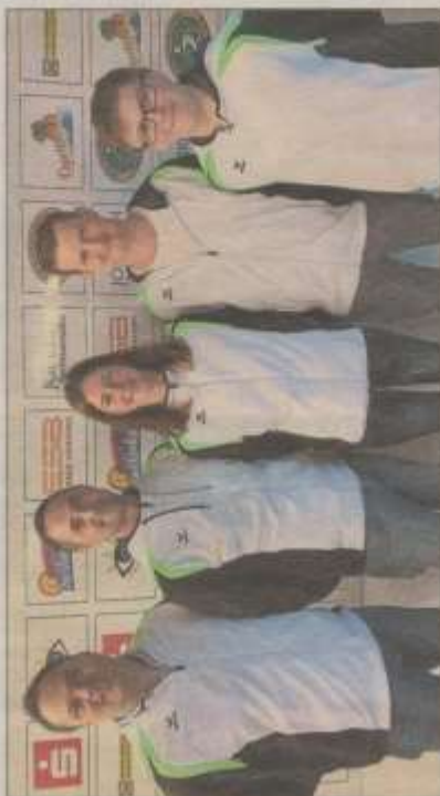
Die Gaumeister Isargrün Goben II.

Isargrün Goben II setzte sich in der Gauberliga bereits frühzeitig durch