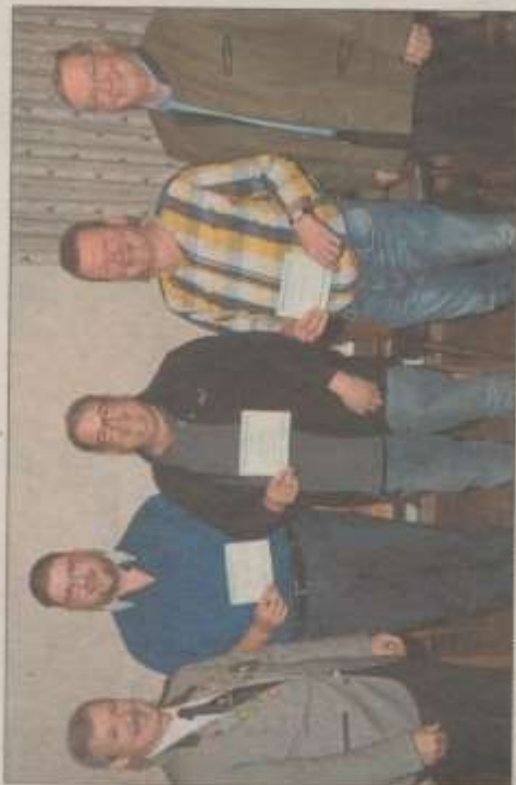
Die drei teilnehmerstärksten Mannschaften durften sich über den Mehrheitspreis freuen.