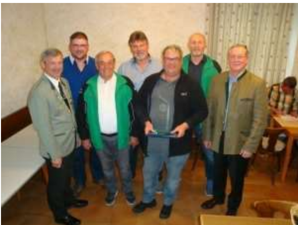
Mannschaftssieger: Schwaigen, Senioren der Eichenlaubschützen, Stockschützen Mammig