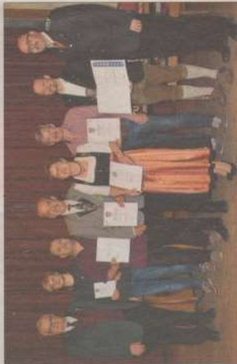
Der Schützengau ehrte auch eine Reihe verdienter Mitglieder.