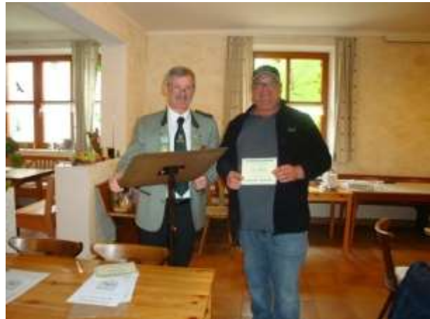
Mehrheitspreis für Schwaigen