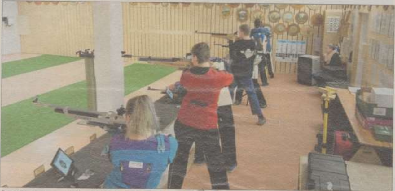
Gute Ergebnisse erzielten die Nachwuchsschützen.

44 Jugendliche traten in Bachhausen an – Nächste Runde am 16. Februar