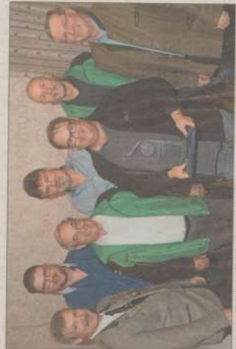
Die Isartaler Manningerschwaigen haben den Wanderpokal wieder zu sich geholt – hier die Vertreter der fünf besten Mannschaften.