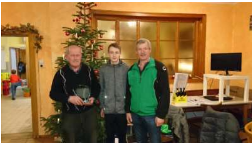
Die ersten drei