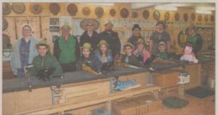
Foto: Die Jungschützen starteten in das erste Faschingsschießen.