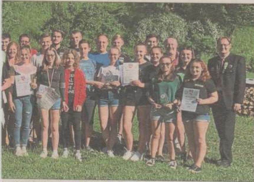
ks, dritte Reihe).