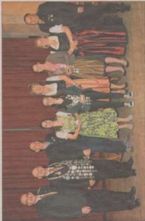
Der Schützengau Dingolfing proklamierte seine neuen Gau-Schützenkönige bei den Damen, den Herren und der Jugend.