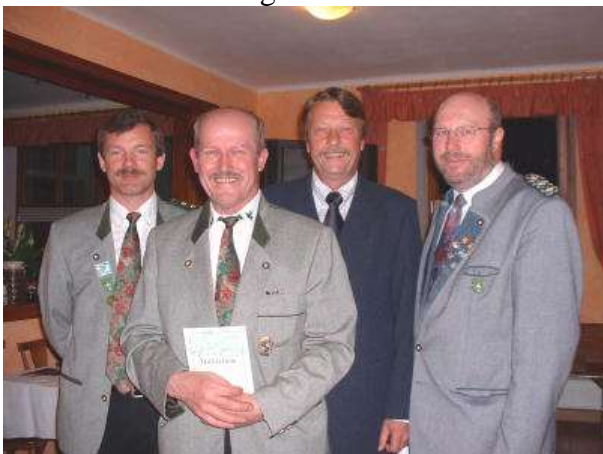
40 Jahre Mitgliedschaft