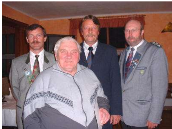
25 Jahre Mitgliedschaft