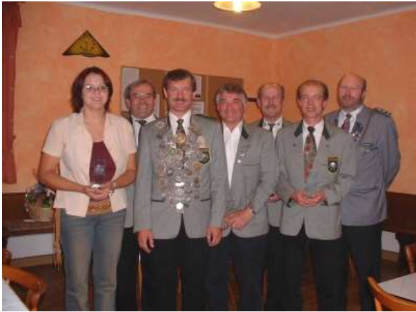
Sieger der Jahresmeisterschaft 2002/3