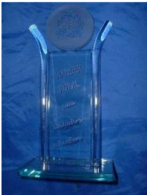
Der neue Wanderpokal für das Neujahrschießen

Die Ersten 5 der Schützen waren: 1. Spanfellner Hans-Peter 102 Punkte 2. Günzkofer Alfons 101 Punkte 3. Pscheidl Franz 100 Punkte 4. Schätz Herbert 98 Punkte 5. Zellner Erich jun. 98 Punkte