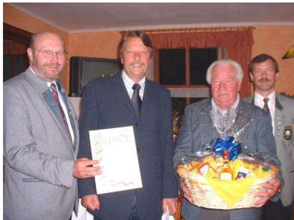
45 Jahre Mitgliedschaft