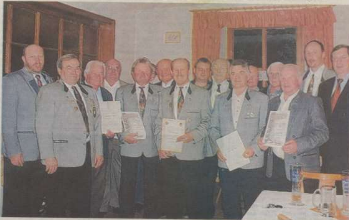
Die geehrten Mitglieder

Rückblick auf zehn Jahre Vereinsgeschichte – Viele Mitglieder geehrt