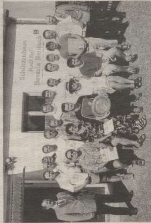
Die erfolgreichen Schützen

Stellvertreter Gauschützenmeister informiert über Änderungen des Waffengesetzes