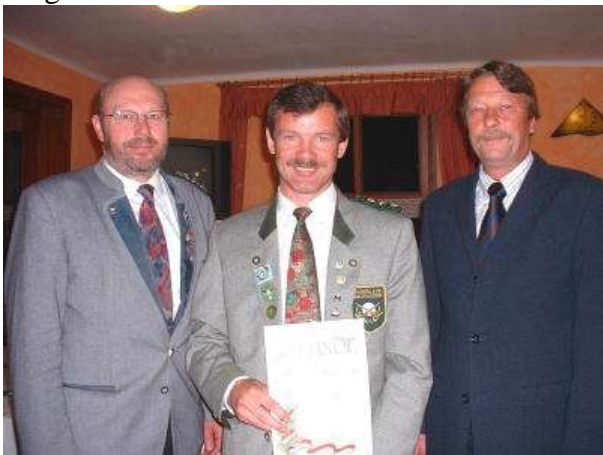
25 Jahre Mitgliedschaft