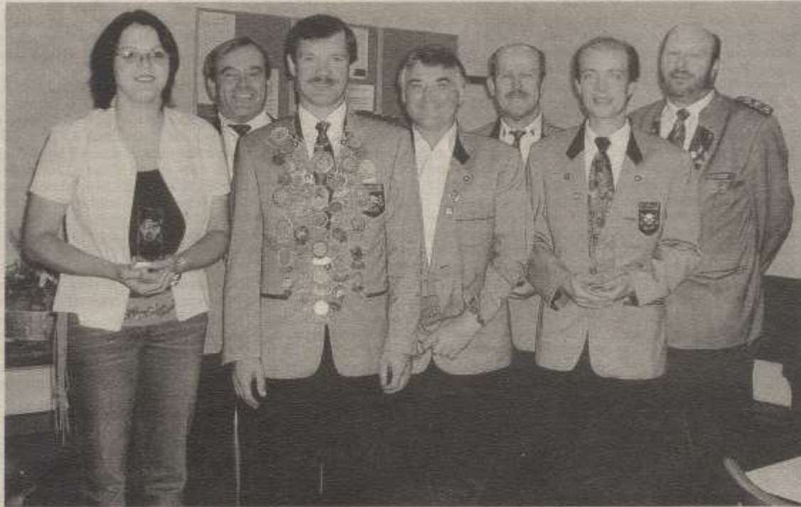
Der Schützenkönig und die Erstplatzierten der Jahresmeisterschaft