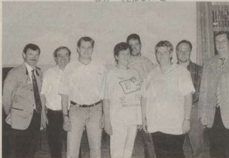
Die Sieger vom Gemeindegießen

Bachhausen. Die Eichenlaub-Schützen veranstalten nach siebenjähriger Pause wieder ein Gemeindegießen. Die Veranstaltung findet an zwei Wochenenden statt. Beginn ist heute Freitag und Samstag ab 18 Uhr in Bachhausen. Aktive Schützen dürfen nicht teilnehmen. Eine Mannschaft besteht aus sechs Schützen. Auch Einzelschützen können sich am Schießen beteiligen. Die Bürger und Vereine der Gemeinde Mamming sind eingeladen. DD 25.04.03