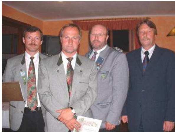
25 Jahre Mitgliedschaft